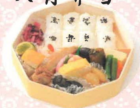
はちかくべんとう 八角弁当