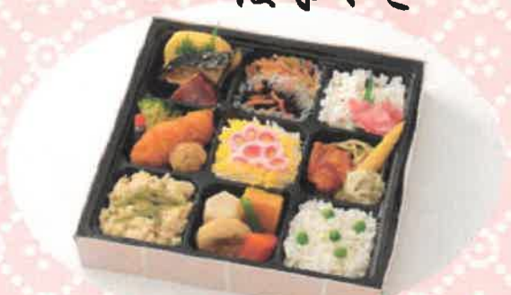
はなやぎ はなやぎ