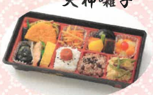
てんじんばやし 天神囃子