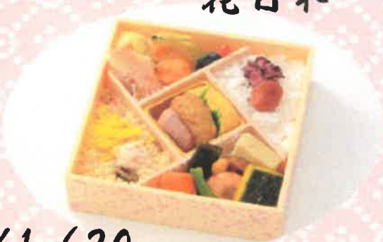
はなびより 花日和