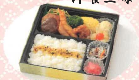
ようよくぎんまい 洋食三昧