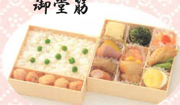
みどうすじ 御堂筋