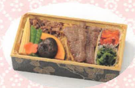
焼肉・すき焼き雅膳