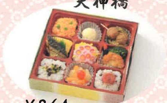
てんじんばし 天神橋