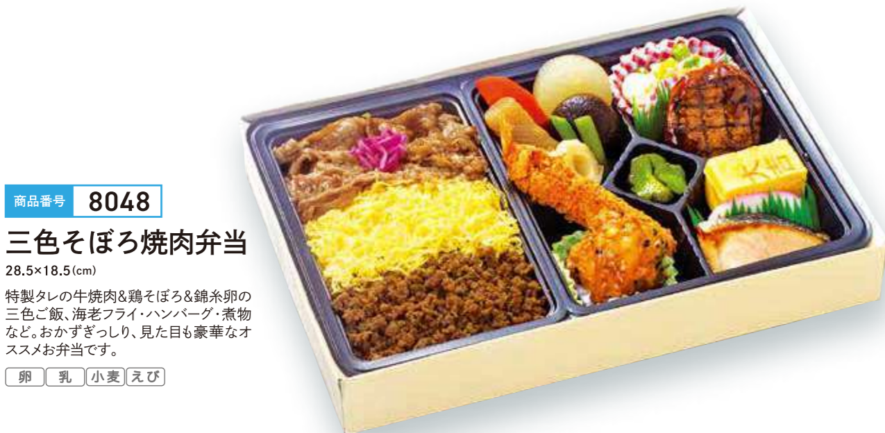
商品番号 8048 三色そぼろ焼肉弁当 28.5×18.5 (cm)

卵 乳 小麦 牛焼肉、鶏の黒ごま揚、ミンチカツ、焼鮭など、人気おかずと煮物・フルーツ・四種のご飯を盛り合わせた、最後の一口までおいしいゴージャスなお弁当です。