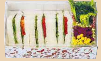
商品番号 8116 乳 小麦

トマトたまごサラダ・チキンカツ・ハム・ツナサンド、オ ムレツ、ポークウインナー、フルーツ