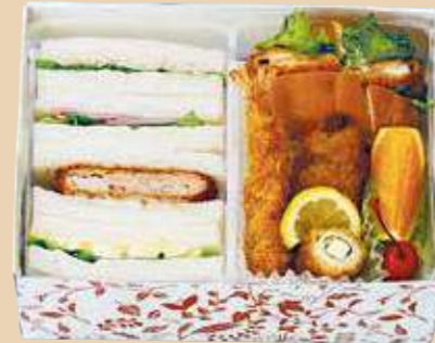
商品番号 8121 卵 乳 小麦 えび

テリヤキチキン・トマトチーズサンド、クロワッサン、マー ブルチーズ、スパイスシュリンプ、ポークウインナー、ブ ロccoli、紫キャベツマリネ、オレンジ