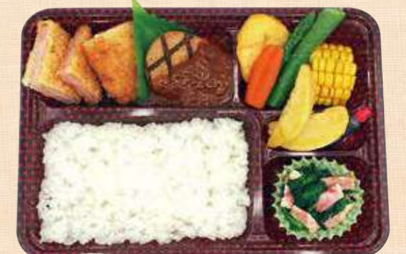
商品番号 8061 ごはん大盛 ハンバーグミックスDX 25.6×19.0 (cm)

卵 乳 小麦 定番人気の鶏の唐揚、甘酢あんかけ肉団子、野菜コロッケ、ひじき煮など。唐揚げだけでは足りない方におすすめです。