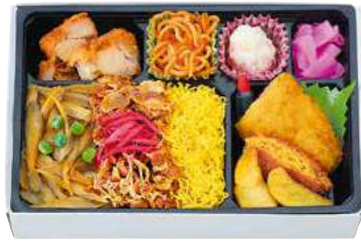
商品番号 8140 洋風焼肉DX 24.5×16.5 (cm)

卵 乳 小麦 特製タレで味付けした牛焼肉の三色ご飯、鶏の南蛮揚、ナポリタン、ポテサラ・カレーコロッケなど、ご飯の進むデラックスなお弁当です。