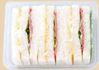
商品番号 8124 卵 乳 小麦