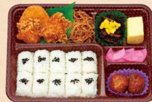
商品番号 8057 ごはん大盛 からあげDX 25.6×19.0 (cm)

卵 乳 小麦 えび 野菜あんかけ肉団子、イカの豆板醤炒め、海老チリ・焼売・春巻など中華風の定番メニューを一度に楽しめるお弁当です。デザートには香ばしいゴマ団子をどうぞ。