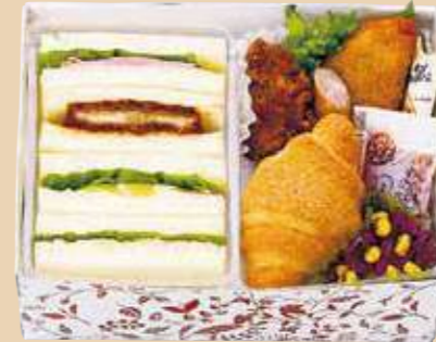
商品番号 8118 卵 乳 小麦

トマトたまごサラダ・チキンカツ・ハム・ツナサンド、エ ビカツロールサンド、オムレツ、マーブルチーズ、フ ルーツ