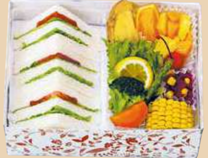
商品番号 8122 乳 小麦

たまごサラダ・エビカツ・ハム・ツナサンド、エビカツ ロールサンド、エビフライ、白身魚フライ、チーズチキン フライ、レモンライス、フルーツ