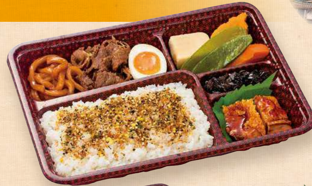
商品番号 8054 ごはん大盛 すき焼きDX 25.6×19.0 (cm)

卵 乳 小麦 えび 特製タレの牛焼肉&鶏そぼろ&錦糸卵の三色ご飯、海老フライ・ハンバーグ・煮物など。おかずぎっしり、見た目も豪華なおススメお弁当です。