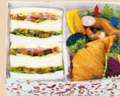
商品番号 8120 卵 乳 小麦 えび

トマト・レタスサンド、ポテトフライ、紫キャベツマリネ、 グリーンサラダ(ブロッコリー・アスパラ・コーン・人参・ レタス)、フルーツ