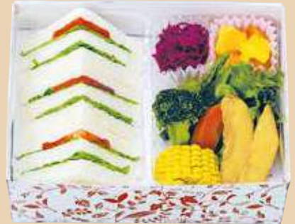
商品番号 8119 乳 小麦

ハム・ロースカツ・ポテトサラダ・ツナサンド、クロワッ サン、白身魚フライ、鶏の唐揚げ、ポークウインナー、紫 キャベツマリネ&コーン