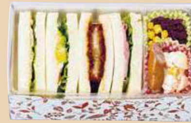
商品番号 8114 卵 乳 小麦