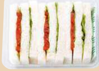
商品番号 8128 乳 小麦