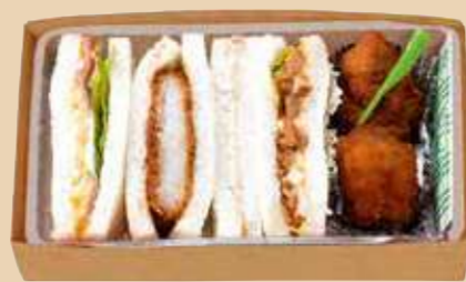
商品番号 8127 卵 乳 小麦