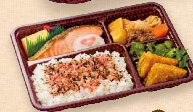
商品番号 8055 ごはん大盛 焼鮭DX 25.6×19.0 (cm)

卵 小麦 牛すき焼&味のしみたうどん入り。煮物や鶏もも肉の照焼、昆布の佃煮も入れて、ご飯の進むお弁当に仕上げました。