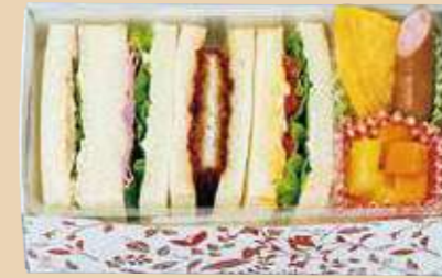
商品番号 8115 卵 乳 小麦

ハム・ロースカツ・ポテトサラダ・ツナサンド、マカロニ サラダ、紫キャベツマリネ&コーン、ポークウインナー