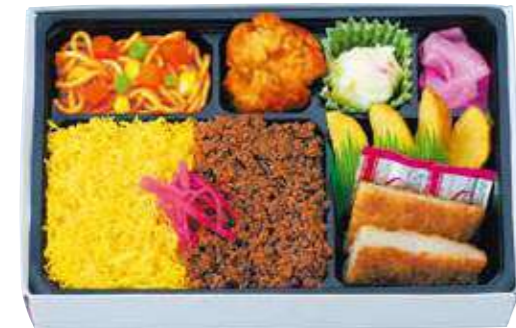
商品番号 8046 二色そぼろトンカツ弁当 24.5×16.5 (cm)

卵 乳 小麦 焼肉&錦糸卵の二色ご飯にチキンカツ、野菜あんかけ肉団子、焼そばやフルーツなど、色んなおかずをバランスよく詰め合わせました。