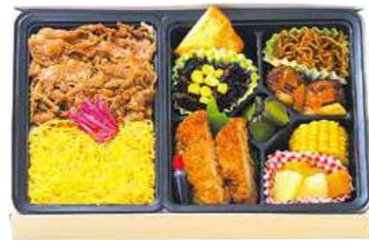
商品番号 8045 二色焼肉チキンカツ弁当 28.5×18.5 (cm)

卵 乳 小麦 特製タレで味付けした牛焼肉の三色ご飯、鶏の南蛮揚、ナポリタン、ポテサラ・カレーコロッケなど、ご飯の進むデラックスなお弁当です。