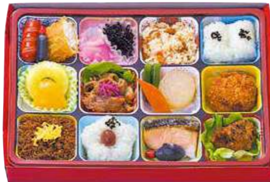
商品番号 8047 洋風ゴージャス弁当 29.0×20.5 (cm)

卵 乳 小麦 ご飯の進む鶏そぼろ&錦糸卵の二色ご飯、トンカツ&鶏の唐揚、ナポリタンやポテサラなど、食べ応えのあるメニューを詰め合わせました。