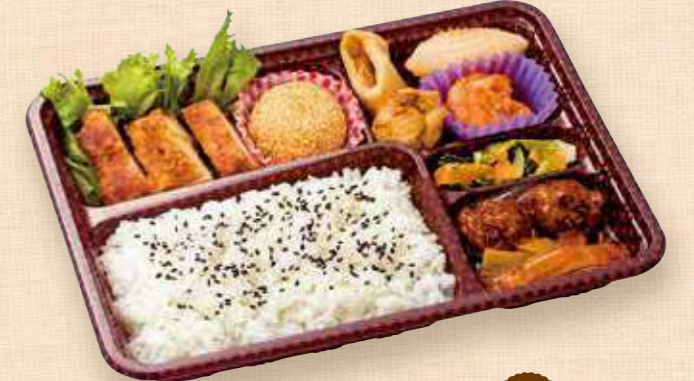
商品番号 8056 ごはん大盛 中華DX 25.6×19.0 (cm)

卵 乳 小麦 素材の味を活かした鮭の塩焼をメインに、肉じゃが・カレーコロッケ・胡瓜漬を詰めた定番人気の鮭弁当です。