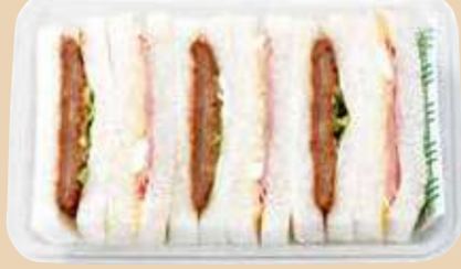
商品番号 8125 卵 乳 小麦