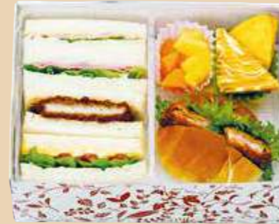
商品番号 8117 卵 乳 小麦 えび